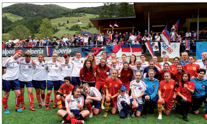
Zhromadny foto po hrě žónskeje wubranki přečiwo mustwu Okcitančankow dnja 19. 6. 2016 w Mühlwaldže

młódsich stawiznach wubranki najsylniši cyłk zestajić. Tež mjezsobu namakachu so młódszi koparjo jako zhromadny cyłk, štož woni tež zjawnje wuprudžichu. Tole hodži so jako dobry zakład za dalše přemyslowanja serbskich zamołwitych zrozumić, dale do rěčnych rumow, kotrež su ze sportom zwjazane, inwestować.