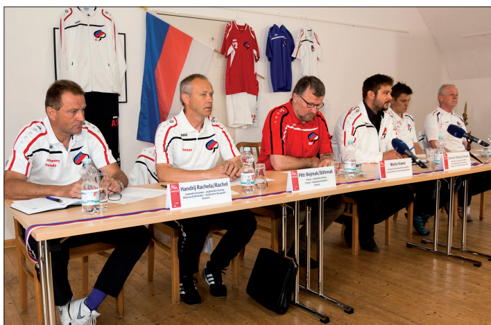
Medijowa konferenca w přihotach na Europeadu dnja 25.5.2016 w Njebjelčicach

Wobstajne medijowe džěło, kotrež so přez referenta Domowiny zaručeše, móže so jako spomóżne hódnoćić. Jedyn z cilow organizatorow, běše dale wuwianje zjawneho wobrazu Serbow a sposrědkować na tutym puću informacije wo mjeńšinje a jeje položenju.