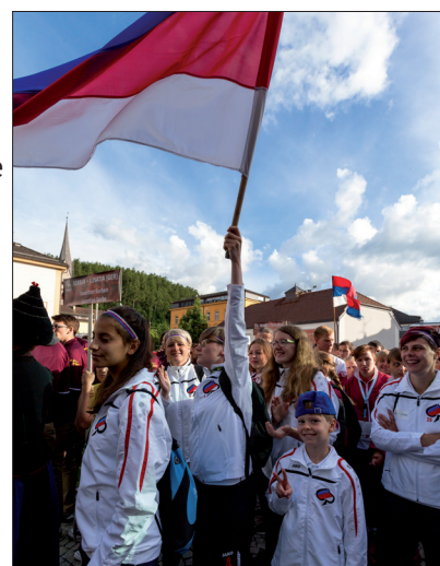
Witanje delegacijow 18. 6. 2016 w Bruneku