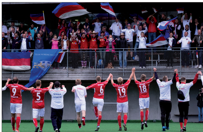
Serbski fanowy blok w Mühlwaldže

Njeličomne přinoški w rozhlосу a nowinach na to pokazuja. Dale hodži so tule naspomnič, zo je tež wužiwanje modernych medijow při realizaciji zjawnostneho koncepta w fokusu stať. Tak hladaše so nimo klasiskeho zjawnostneho džěta tež zjawnostne džěto a wutworjenje jedneje tematiskeje serbskeje/serbskoafinej “community” (zhromadnosće) přez socialne syće. K tutym nadawkam so přidruži nimo toho techniske a distributiwne dale wuwijanje serbskeho live-streama, kotryž je tójšto dalšich recipientow na cyłym swěće přiwabiť.