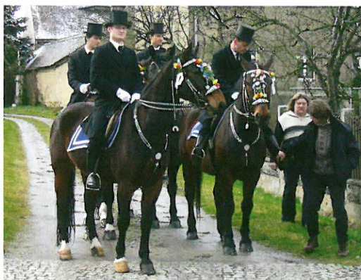
Ausritt – Auf dem Weg zur Kirche

Ostern ist bei den Christen das größte Fest im Jahreskreis. Es verheißt die Auferstehung Jesu und verkündet die frohe Botschaft vom Neubeginn des Lebens nach dem Tod.