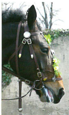
Geschmücktes Pferd zu Ostern