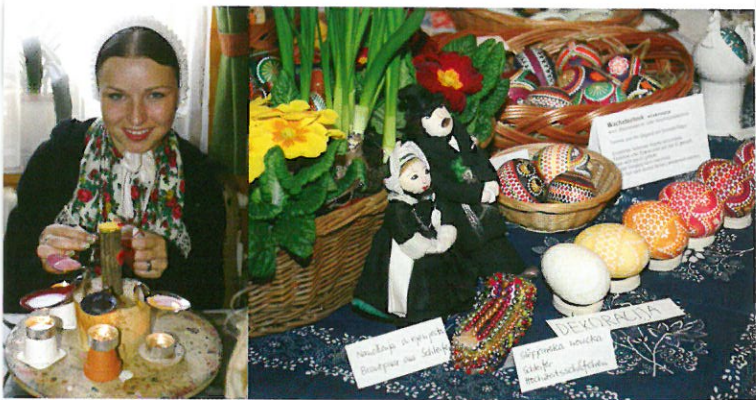
Mädchen in Hoyerwerdaer Tracht beim Ostereiermarkt in Neuwiese/ Nowa Łuka

Bei der Kratztechnik werden die Eier kräftig gefärbt, anschließend wird mit einem scharfen spitzen Gegenstand in die farbige Eierschale das Muster eingekratzt. Die Ornamentik ist filigraner und zierlicher. Beliebte Motive sind das Herz als Symbol für Treue und Liebe, Dreiecke für göttliche Trinität und Blumen und Ranken für den Lebensbaum als Symbol der Fruchtbarkeit.