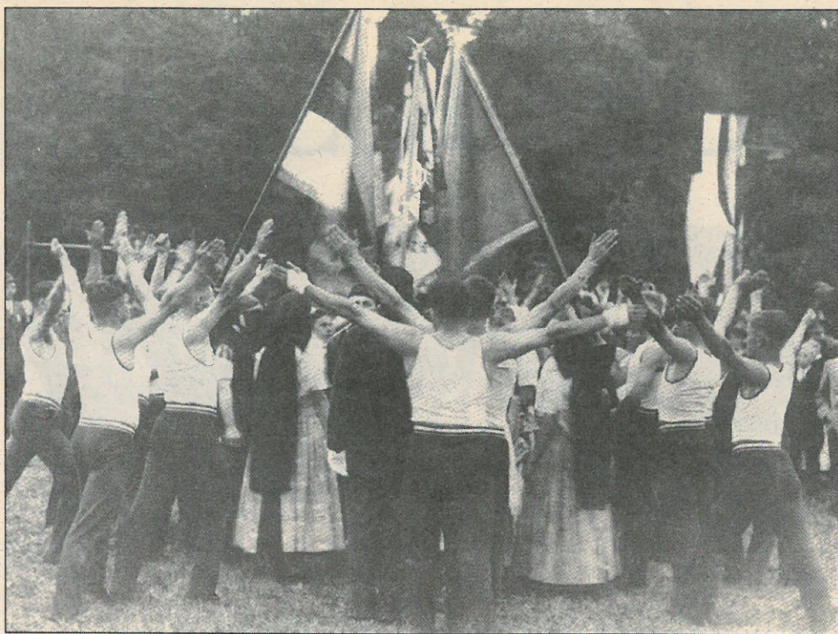
Ralbičeno wustupichu ze scenu na swjedźenju Kulowskeje jednoty w Sulšecach.