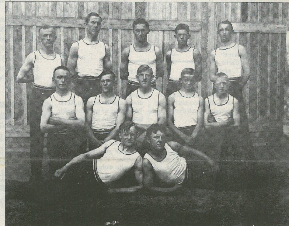
Scyła přeni wustup Serbskeho Sokola na župnym zléće Župy Fügneroweje 1922 w Mladej Bolesławje. Drustwo zwučowacych.

Z rozprawy wo zajězdze do Českeje wuchadža, zo wobdžělichu so na nim sokołjo a sokołki. Na naspomnjenym wobrazu pak widžimy jenož skupinu mužů. Ma něchtó podložki, snano samo fotografije wo wustupje serbskich hólcow a holcow? Jednač móže so při tym prawdžepodobnje jenož wo młodych Serbow z Budyseje, Bukečanskeje a Malešanskeje jednoty. W lěće 1922 džě hakle tute tři jednoty eksistowachu. Redakcija Sokolskich Listow by so tež nad informaciju wo tym zwjeseliła, koho na wobrazu „drustwa zwučowacych“ widžimy.