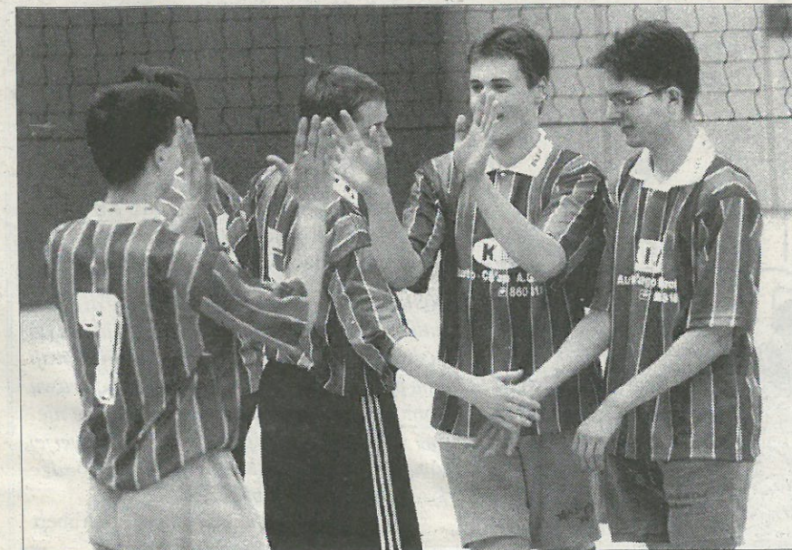
Turněr 1997 w Radworju: dobyčerske mustwo Delnjoserbskeho gymnazija Choćebuz.