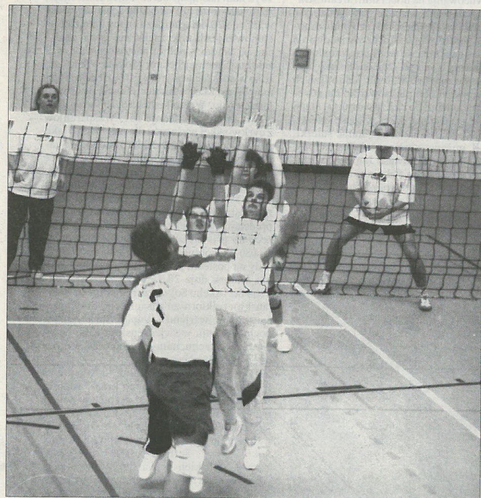
Scena z hry mjez Sokołom Ralbic/Hórki a Kamjonej/Chelnom.