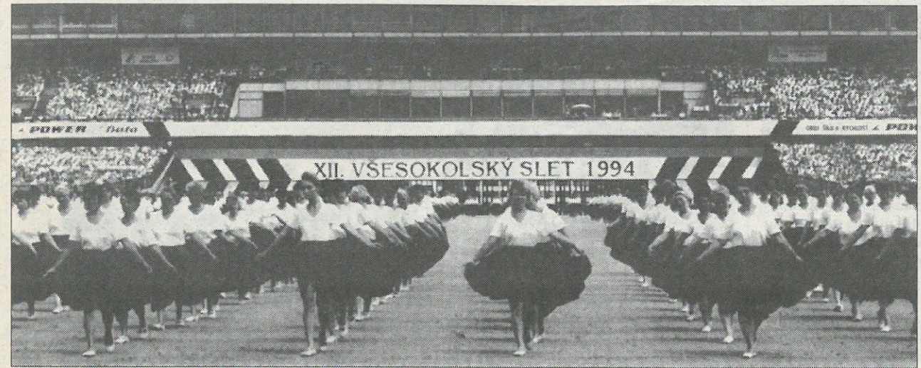
Zwučowa-nje českich žonow na zléće před štyrjomi lě-tami (foto nalěwo). Nastup Serbow k swjedžen-skemu čahej 1994 na Vá-clavskim naměsće (foto de-le-ka).