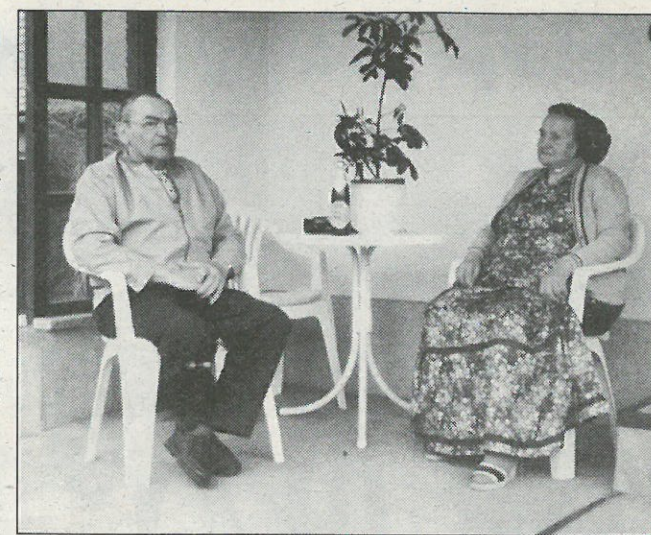
... a džensa ze swojej mandželskej před domčekom w Ralbicach.

Tuž hrajachu na lěsnej tuce mjez Ralbicami, Nowoslicami a Jitkom. Tam, hđžež stej džensa kormjernja swini a Delanske rěznistwo. Wrota sej z někotrych žerdži hromadže spaslichu. Dokelž njemějachu na spočatku žane saki za wrota, so často wadžachu, hač je bul do wrotow abo nimo wrotow šol. Wulki problem bě w powójnskich lětach dóstać jenu sportowu drastu za cyłe mustwo. Tež kopački (tepy) njemóžeše sej kóždy wjesny pachol kupić. Tohodla hrajachu někotři boso, pozokach abo w normalnych črijach. Někotři móžachu sej znajmjeńša sportowe črije („cwički“) w Českej wobstarać.