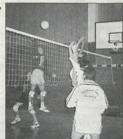
Scena z finalneje hry volleyballoweje turněra Sokoła wo pučowanski pokal Serbskich Nowin mjez Worklecami a Serbskim gymnazijom.