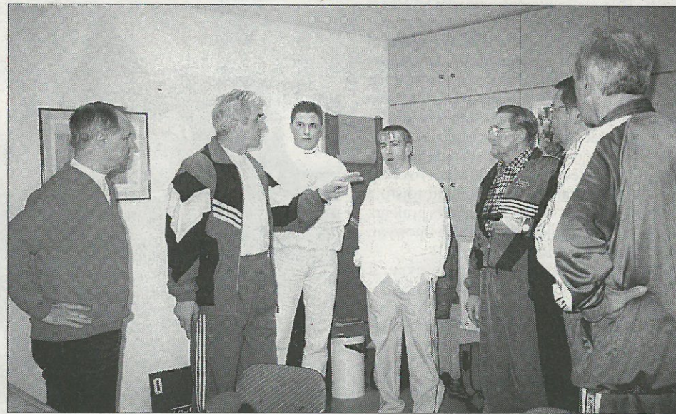
Poslednje dorěčenja do zabeħa turněra mjez nawodnistwom a sudnikami.