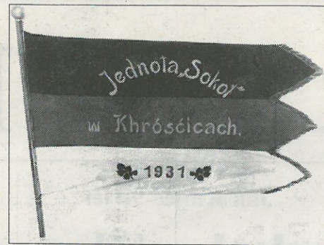
Chorhoj Chróšćanskeje jednoty