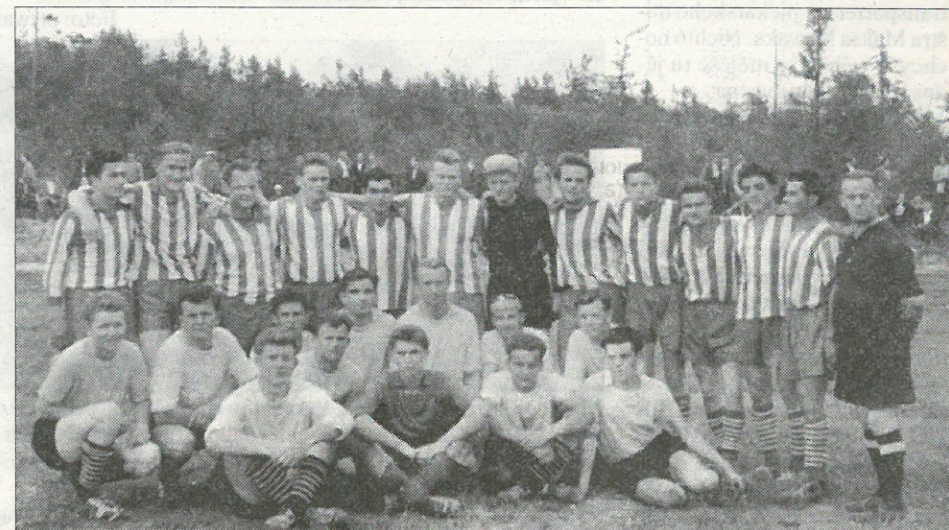
Skladnostnje 10lětneho wobstaća SJ Hórki so koparskej mustwje z Hórkow (zady) a Chróscic (předku sedžo) přihladowarjam prezentowaštej.

Budyšinje chodžachmy, zhotowichmy sej w nowemburu 1949 přenje styristronkate sportowe wupokazy, w kotrychž mjějachmy město fotowobsydniaka wopon ze serbskimi barbami. Tute samowudžělane wupokazy kóždy člon młódzinskeho mustwa z česćownosću při sebi nošeše. A léto pozdižo, w decemburu 1950, wudžělachmy sej hišće nowe wupokazy za dalšich člonow, tónraz pod mjenom SG Granit Horka a z přinoškowej stronu na 4 léta. W samsnym léce bě Jan Warnar tež zhotowił čestne diplomy