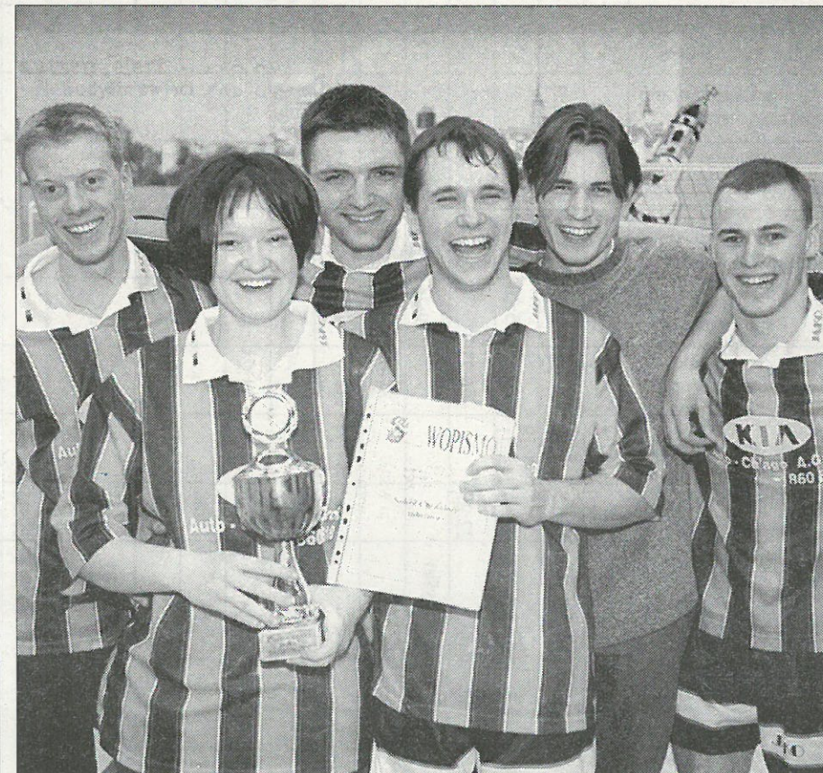
Dobycerske mustwo Sokol Choćebuz-młodžina

Hačrunjež bě so turněr poradził, su tola dalše polěpšnja, změny móžne. Namofwjamy tohodla mustwa abo jednotliwcow, zo bychu předsydstwu Sokola namjety za hišće lěpše přewjedzenje turněra posrědkowali. J. Šwon