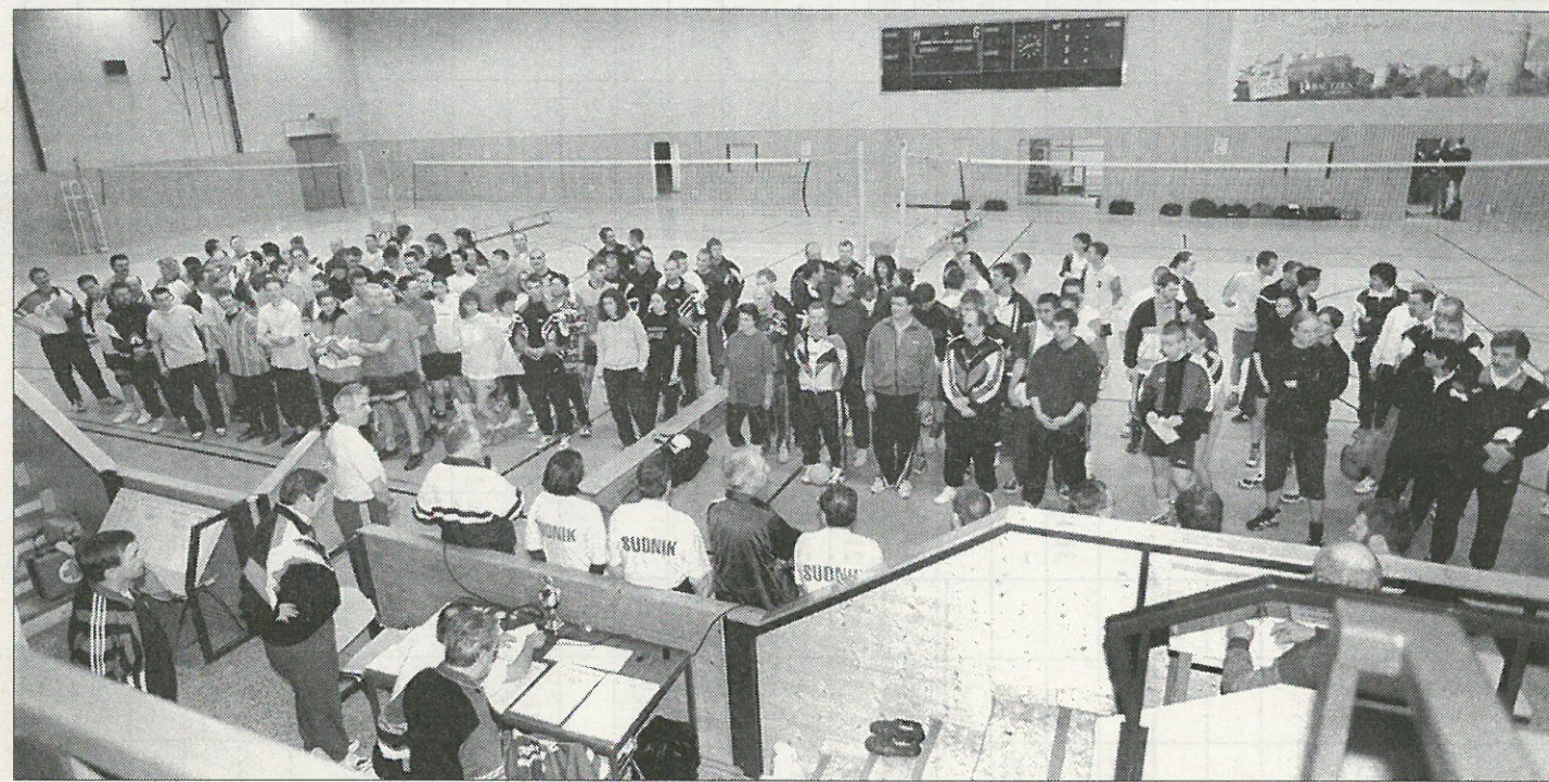
24 volleybalowych mustwow nastupi k jubilejnemu turněrej.