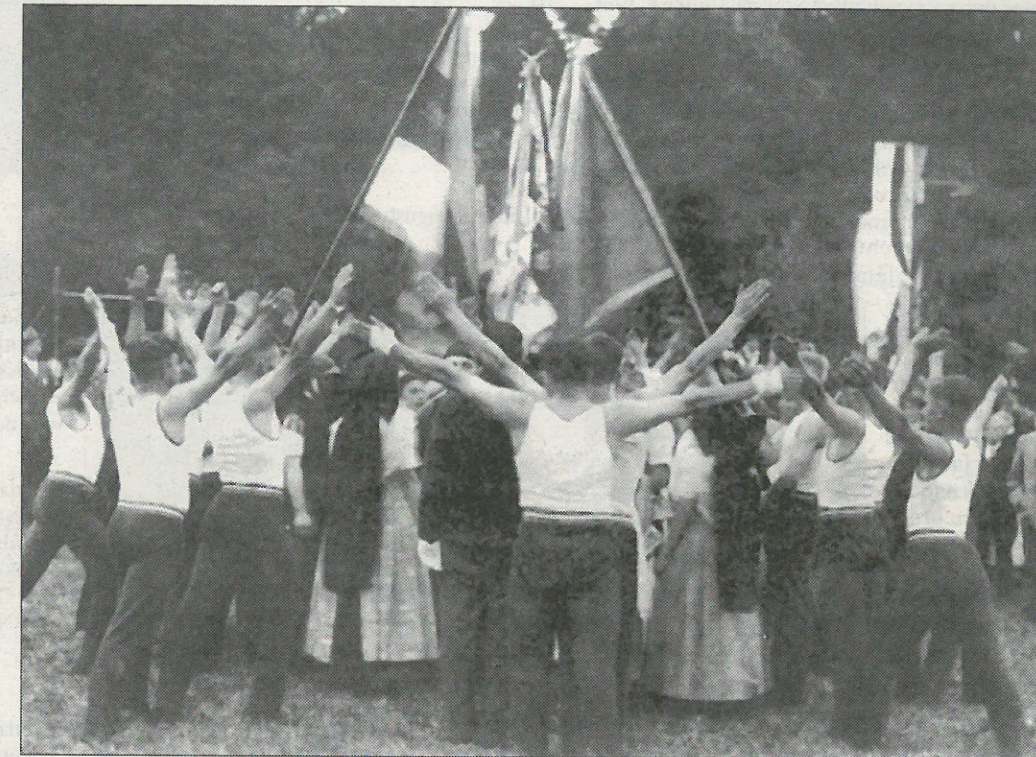
Ralbičenjo na sokolskim swjedženju Kulowskeje jednoty 1931 w Sulšecach

Wot 27. do 29. junija woswjeć w Ralbicach załoženje jednoty Sokoła před 80 lětami. Sokolske Listy chcedźa w předležacym čísle k stawiznam sportowanja w Delanach tři strony wěnować. Podawamy přehlad wažnych podawkow wot lěta 1923 hač do přitomosće, wěnujemy so Ralbičanskej kopańcy a wozjewjamy dokument z lěta 1933 wo počinanjach nacijow přećiw serbskim sportowcam a wo proteście Jakuba Žura přećiwu tomu. K stawiznam sportowanja w Ralbicach doporučamy tež přinoški w slědowacych číslech SL: w čísle 2/1996 („Wyšiny a nižiny Ralbičanskeje kopańcy“, „Přehlad k sportowym stawiznam w Ralbicach“), w čísle 5/1998 („Feliks Statnik 70 lět“), w čísle 5/2000 („Kak dóndže před 25 lětami k zjednočenju koparjow Ralbic a Hórkow“) abo w čísle 5/2001 („Jurij Frencl: Mój puč do Sokoła“)