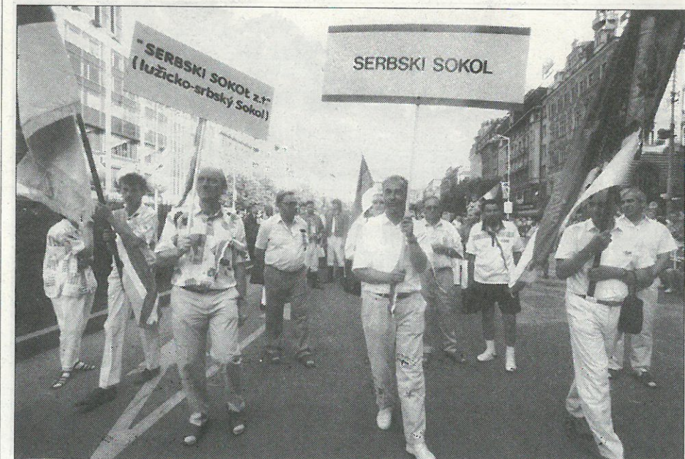
Swjedzenski čah wšosokołskeho zléta 1994 w Praze