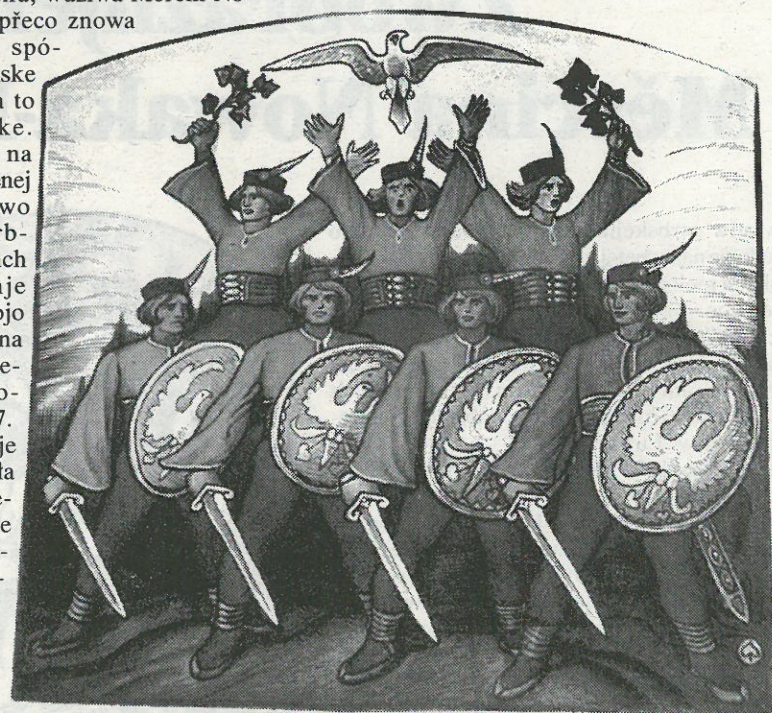
Ryčerjo z Lubina, 1933, akwarelérwana rysowanka, priwatne wobsydstwo

Zwobraznjenje serbskeho Sokola a jeho drasty nje-woznamjenješe Měrcinej Nowakej-Nječorínske- mu jeničce re- flekcija abo do- kumentacija spor- toweho hibanja, tež nic, hdyž bě to nimale jenički