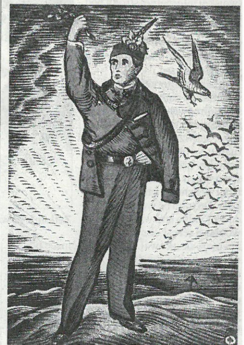
Pohladnica z motiwom serbskeho Sokoła, 1927

Za wuchadziščo swojeho wuměłstwa měješe Měrcin Nowak-Njehorński ludowe wuměłstwo. Běchu to rjekajo ze słowjanskich stawiznow a powěsćow, služace jemu jako přiklad a žorlo – hač bě to zwobraznjenje słowakkeho