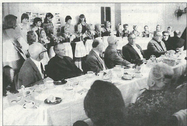
Zetkanje bywšich Sokolow w měrcu 1982 w Budyšinje.

Wužiwar internetnej sokol- skeje strony namaka na njej tój- što zajimaweho. Titlna strona pokazuje z rubrikami towar- stwo, stawizny, historiske, ak- tualne, wobrazy, člonstwo a kontakty hižo dobry přehlad wo stawiznach a džzensnišim džěle léta 1993 znowa založeneho So- kola. Do toho bě wón wot 1920 do 1933 hižo jara wuspěšnje we wobłuku serbskeho narodneho žiwjenja skutkował. Serbsce a němsce poda- watej so krótki stawizniski zarys a přehlad wo džzensnišim hibanju towarstwa. Zestajenje wu- dospołnjaceje časoweje stawizniskeje tabele njeje wšak tak lochke, wosebje při wuběru jednotliwych podawkow. Tola na čož je so tule zabyło, je „Zetkanje bywšich Sokolow“ dnja 10. měrca 1982 w Budyskim Serbskim do- mje. Mjenuje-li so swjatočne zarjadowanje k