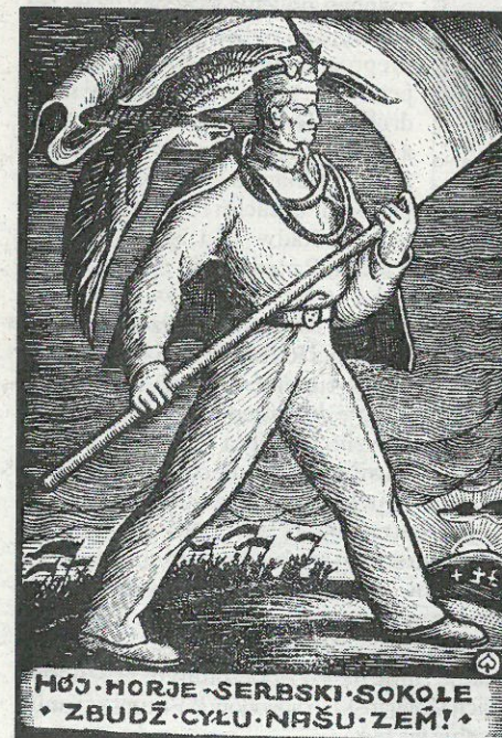
„Hój, horje, serbski sokole“, 1930, pjerokrjesba