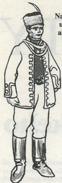
Načiski za paradnu uniformu, 1925, akwarelérwana rysowanka, priwatne wobsydstwo