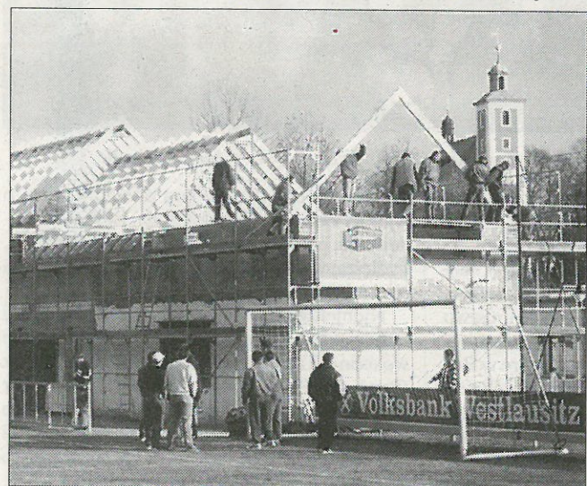
Twarske džěła na sportowym kompleksu w nalěcu léta 2000

10. mjezynarodnemu gmejskemu swjedženju stworjeny.