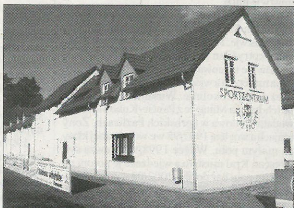
Kompletny sportowy dom po dotwarjenju w něčim stawje 2004