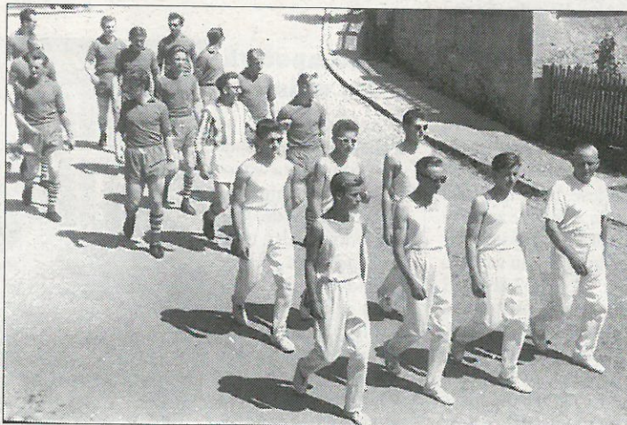
Čěłozwučowarjo a koparjo na sportowym swjedenju w 60tych lětach