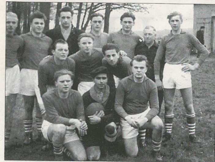
Prěnje koparske mustwo kónc 50tych lět