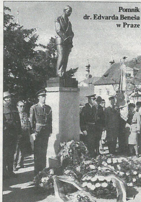
Pomnik dr. Edvarda Beneša w Praze