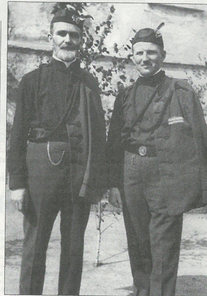
Radworčenjo hraju samo we wuchodosakskej lize. Nawka wužiwa wjacróć słowo „puch“ město bula, „z hřišća“ je wuraz po českim „hřiště“, štož džě je hrajnišćo – móhlo pak tež być skrótšene „z hrajnišća“ po serbskim wurazu. A pasaža, zo chce puch-bul „bić we wrota“, móže so jako čišćerski zmylk wukładować – móhlo rěkać „bić wo wrota“, ale tež w zmysle „dostać so do wrotow“ móža so słowa wuložować. Mikławš Krawc

Na tutej stronje wozjewjamy tež Nawkowu baseń „Wěno našim Radworskim“. Ju stwori awtor 3. awgusta 1948 a wozjewi ju w Nowej dobjě w čísle 78/1948. Wěnowana bě wona tehdy sławnemu koparskemu mustwu w Radworju, kiž za sej mjeno Slawija. (Džensniša sportowa hala we wšy ma samsne mjeno, pisa pak so Slawia.)