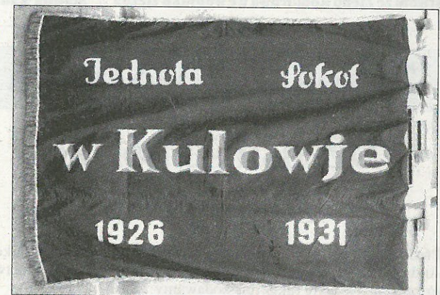
Na farje w Kulowje je chorhoj přjedawšeho Kulowskeho Sokola.