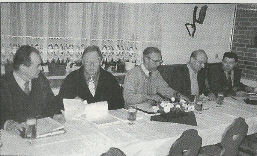
Hłowna zhromadźizna Sokoła 15. januara 1999 w Hórkach