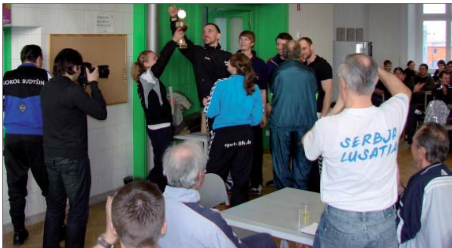
Hrajerjo mustwa „Přeceljo Smječkecy“ pokazuja hordže dobyćerski pokal.