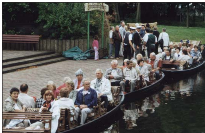
Čłonojo župneho wuľeta běchu tež po Błóťowskich groblach po puću.

Impresum: Naša Domowina - Informacije třěšneho zwjazka • Informacije kšywowego zwězka • Informationen des Dachverbandes