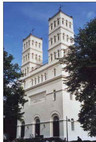
Krasna cyrkej, natwarjena po planach architekta Schinkela w Tšupcu.