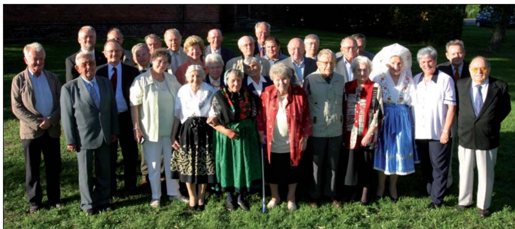
Kupcyne foto dłužkolětnych aktiwnych čłonkow Domowiny, kótarež su na swětočnosti dnja 8. septembra w Hochozy dóstali wósebnu medalju „Župa Dolna Łužyca – 50 lět čłonk – 8.9.1946 we Wjerbnje“.