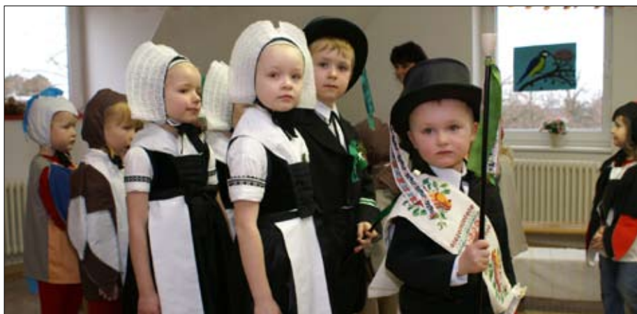
Ptači kwas w Rownjanskej pěstowarni.

Domowiny a člon Džěloweho zjednoćenstwa hórnistwa Slepó