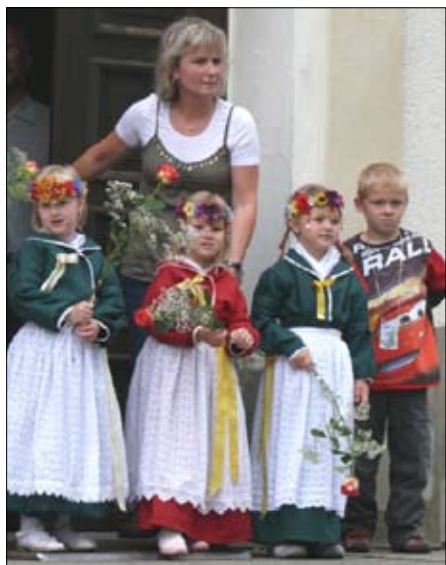
Dobra nalada knježeše na léčnym swjedženju pěstowarnje SŠT w Malešecach.

Lětsa su so w Malešecach na léčny swjedžen pěstowarnje wosebje dołho a intensiwnje přihotowali. Zhromadnje ze staršimi pytaču mjeno za swoju pěstowarnju. Kotra postawa pak by so lěpje hodžała hač wódný muž? Wšako ma wón w bliskich Malešanskich hatach idealne bydlenčko. Tež kóžda skupina wupyta sej bajowu postawu za swójske mjeno. Tak chodža džěći nětko do skupiny lutkow, wódných mužow, błudničkow a zmijow. Mjena bajowych postawow wotwěraja džěćom wutroby za stawiznički serbskich prjedownikow a budža lubosć k přirodže a domiznje.