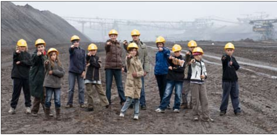
Wobdźelnicy filmowego projekta „Brunica - serbske słowo a hudźba“.