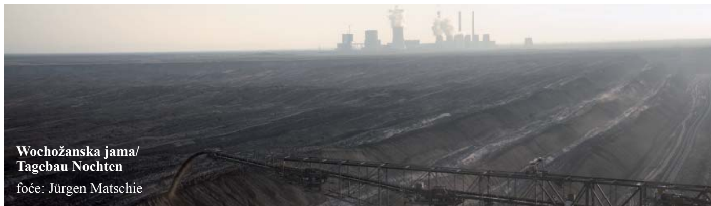
Wochožanska jama/ Tagebau Nochten