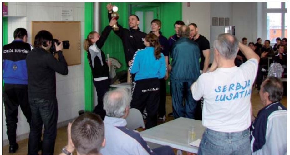
Hrajerjo mustwa „Přeceljo Smječkecy“ pokazuja hordže dobyćerski pokal.