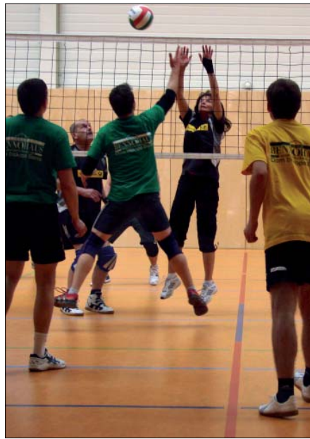
Wo kóždy bul je so horco wojowalo.

Přeni raz přewjedžechu so sobotu, 27. februara 2010, hry najwjetšeho ludosportowego zarjadowanja w halomaj Serbskeho šulskeho a zetkawanskeho centruma w Budyšinje.