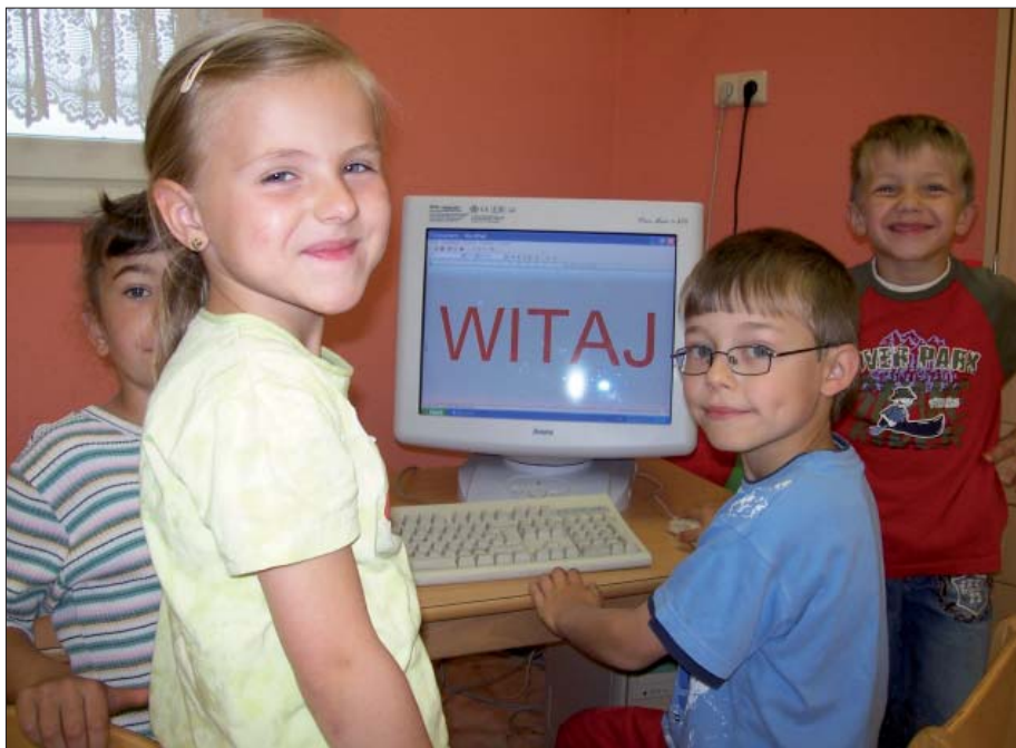
W pěstowarjach Serbskeho šulskeho towarstwa podpěruja wuknjenje serbsčiny z kompjuterom.